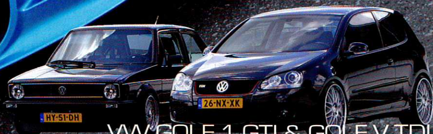
VW GOLF 1 GTI & GOLF V TDI ALS JE NIET KUNT KIEZEN...