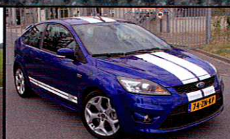
FORD FOCUS ST Krachtig & Vol

En verder: Ford Focus ST | VW Lupo kopen | GTI Tuning International | Carlsson CK 75 Blanchemont | PorscheMotion | WTCC Oschersleben | Mini Hamann | Tuningnieuws