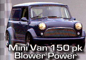
Mini Van 150 pk Blower Power