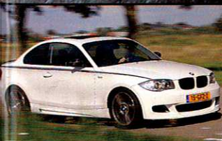
BMW 125i PERFORMANCE M3 in zakformaat