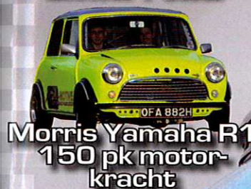
Morris Yamaha R1 150 pk motor- kracht