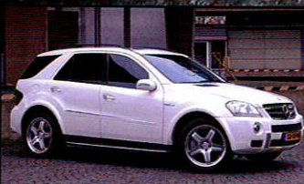
ML 63 AMG Opzij-opzij-opzij