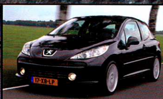
PEUGEOT 207 RC bedreigd