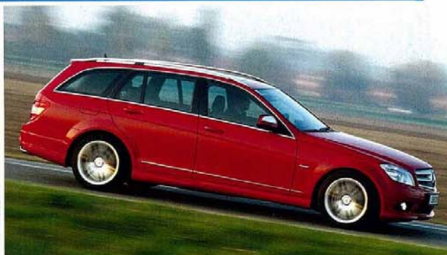
Kombi, Allrad, AMG: Diese Kombination macht den C 320 CDI zum Gerät für alle Lebenslagen. Er ist deutlich kompromissbereiter als der Carlsson