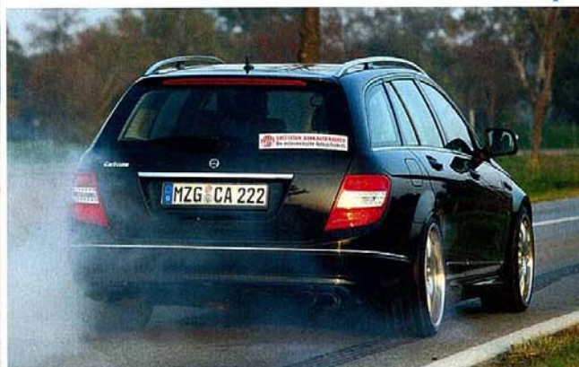
Starker Raucher: 612 Newtonmeter können mit den 255er-Reifen Schlimmes anrichten. Generell ist beim Carlsson aber genug Traktion vorhanden

Andererseits: Der C 320 CDI ist von Werk aus nicht von schlechten Eltern. 224 PS und 510 Newtonmeter sind für die Mittelklasse eine starke Ansage. Und umso mehr drängt sich die Frage auf, ob es sich überhaupt lohnt, weiter an der Leistungsschraube zu drehen.