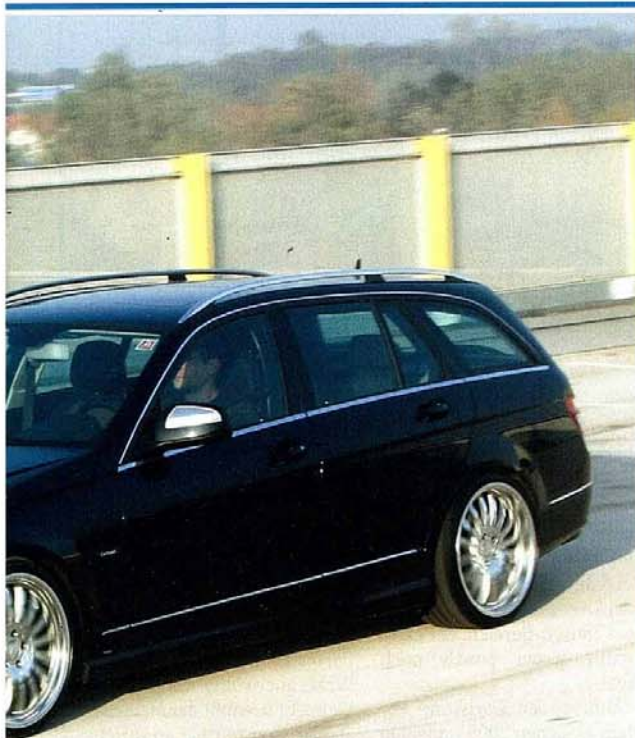
Zweimal C 320 CDI, und doch zwei völlig unterschiedliche Charaktere. Dabei kosten der souveräne AMG 4MATIC (rot) und der lebendige Carlsson CD 32 T (schwarz) fast gleich viel