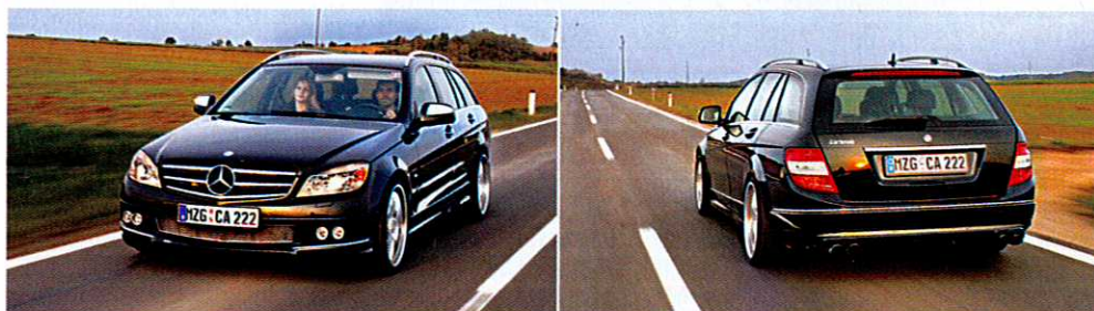
Vorher und nachher Die Schürze mit den zusätzlichen Doppelscheinwerfern schindet im Rückspiegel mächtig Eindruck, erst nach dem Überholen kommt die Wahrheit raus: Carlsson-Emblem statt Stern.

EXTRAS DVD-Navigationssystem € 2.515,-, Sportauspuff 4-Rohr € 2.179,-, Sport-Federnsatz € 783,-, Frontschürze € 631,-, Doppelscheinwerfereinheit € 1.002,60, Seitenleisten € 1.221,-, Heckschürze € 955,10, Sportlenkrad Leder/Alcantara € 1.683,90, Radsatz Ultralight (einteilig geschmiedet) 225/35 R19 vorne, 255/30 R19 hinten € 10.047,-.