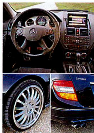
Vorbild Das Lenkrad hat Referenzcharakter, den anderen Zierrat kann, muss man aber nicht mögen.

Geradezu Pflicht ist das mit Leder und Alcantara bespannte Lenkrad, welches optisch Rennsport-Flair verbreitet und haptisch für alle zur Referenz werden sollte. Schade nur, dass dieser Genuss mit gar nicht schlanken 1.700 Euro erkaufte werden muss. Wer es gerne extrovertierter hat, kann zu diversen Schürzen und Schwellern greifen oder auch zu einteilig geschmiedeten Felgen, die jeden noch so kleinen Randstein zum Intimfeind erklären. Christoph Jordan