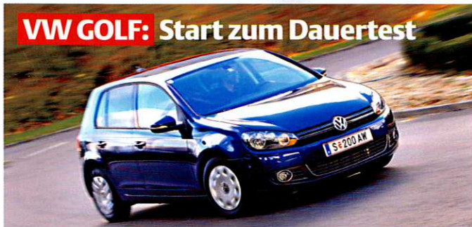
VW GOLF: Start zum Dauertest