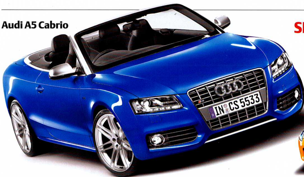
Audi A5 Cabrio

SPASS MUSS SEIN Was bald unser Herz wärmt